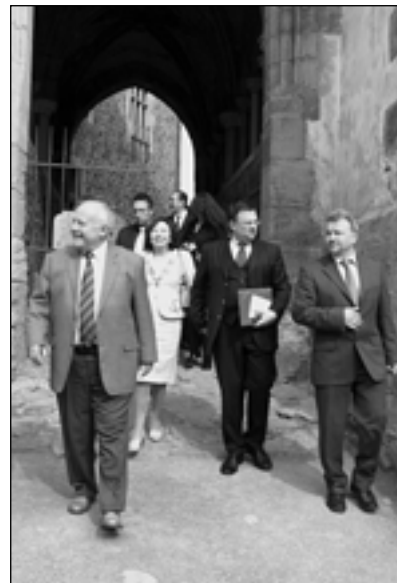
Prohlídka končí, hosté odcházejí branou na dolní nádvoří.