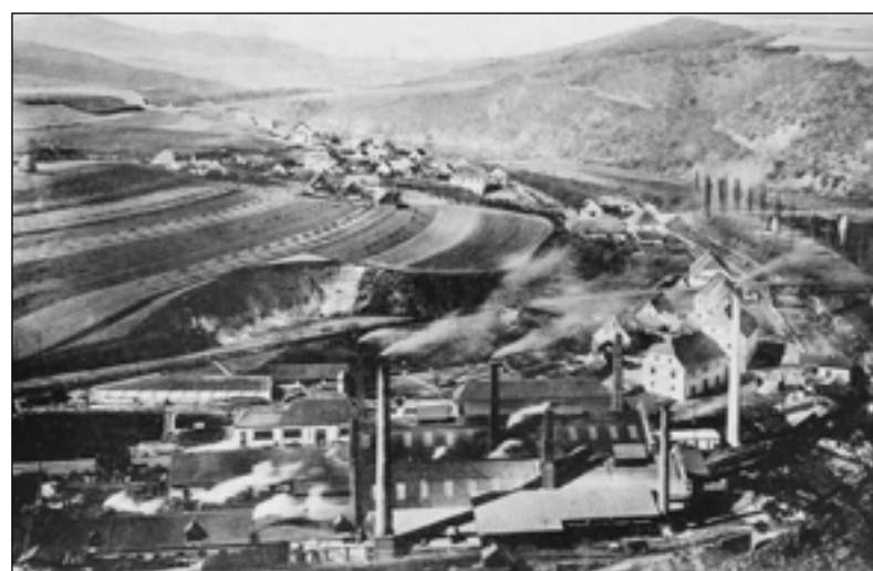
Roztocké železářny na přelomu 19. a 20. století.