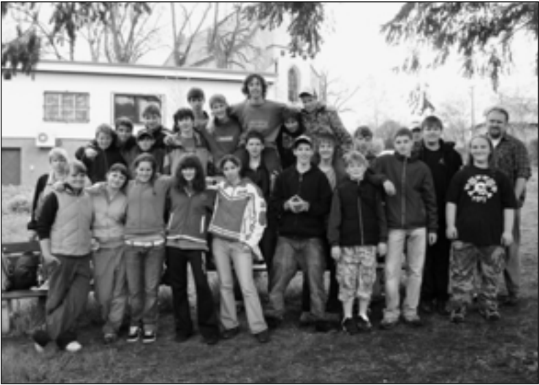
Tak toto je letošní devítka aneb všichni pracanti pěkně pohromadě.