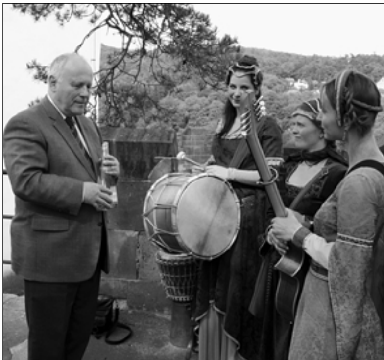
Georg Milbradt děkuje hudební skupině Euphorica, která státní návštěvu doprovázela.