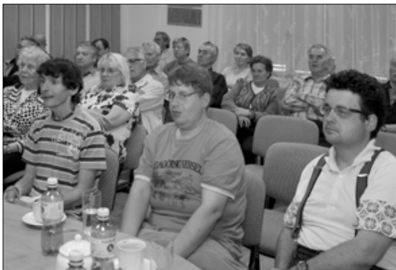
Na promítání filmu o leontýnském zámku, životě v něm a Leontýnce se přišli podívat jak křivoklátské občany, tak přímo tři obyvatelé leontýnského zámku.