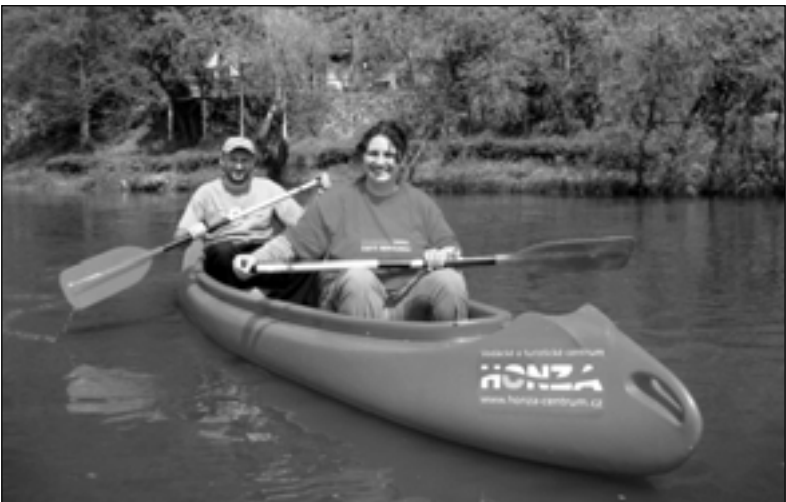
Akce „Čistá Berounka“ je užitečnou zábavou pro každého.