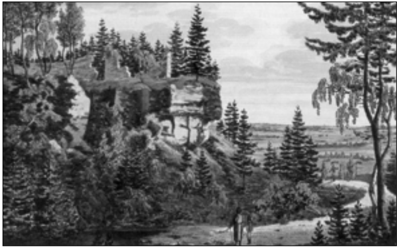
Zbytky Hlavačova na kresbě K. J. Wolfa z roku 1805.