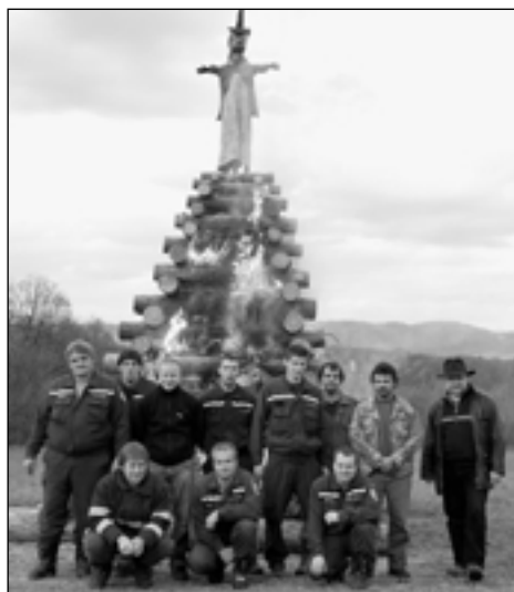
I v Křivoklátské byla 30. dubna upálena Čarodějnice. O hranici se opět postarali hasiči. Krátce po zapálení hranice následovalo i „tradiční“ focení.