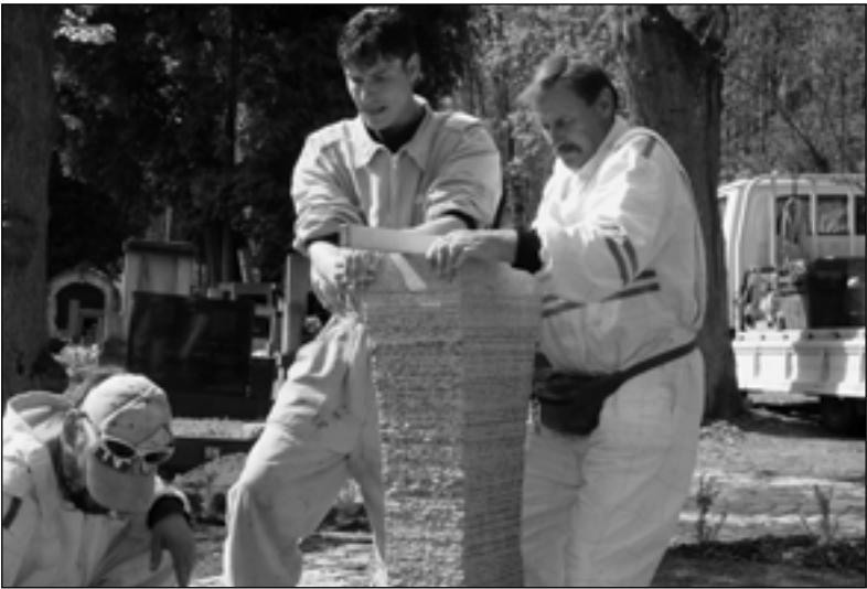
Osazení žulového sloupu je prací pro opravdové chlapy