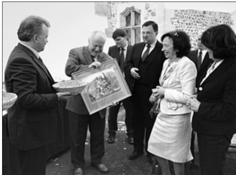
Hosté přebírají dary od správy hradu - kopii veduty z 18. století s vloženým textem upomínajícím tento den na Křivoklátě. Nechybí ani Zbečenský chléb.