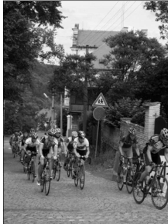
Křivoklátské peklo – Kopce všude, kam se podíváš, aneb Křivoklátské peklo!

lá soutěž bude samozřejmě zcela odloučená od silničního provozu a bude se odehrávat v prostoru zázemí závodu v blízkosti rybníčka na Amalíně. Dráha zručnosti, rychlostní úsek, krasojízda na koloběžce i kvízové otázky – to jsou disciplíny, ve kterých si budou moci zasoutěžit „mladí talenti“. Chceme tím nejen podpořit zájem o sport a zejména cyklistiku u našich potenciálních nástupců, ale také zabavit přítomné děti. Nejlepší závodníci ve všech kategoriích samozřejmě odměníme. Bude nám potěšením, když přijedete a zúčastníte se některé ze soutěží. Vyberte si podle své chuti a schopností – celý etapový závod či pouze hobby okruh. Nechcete-li závodit vy sami, přiveďte své děti. A nemáte-li ani soutěživý ratolesti, přijďte třeba jenom zafandit svým známým.