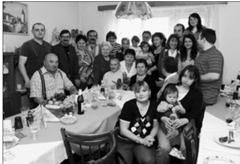
U Ráců se na oslavách sešlo tolik gratulantů, že byt praskal ve švech.

važila dlouhá léta v kuchyni SOUL Písky. Manželům Rácovým přišly k významnému jubileu popřát jejich tři děti, osm vnoučat a většina z jedenácti pravnučat. Odpoledne na své sousedy nezapomněli ani jejich křivoklátské sousedy. O to víc je