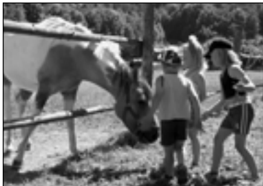
Ilustrační