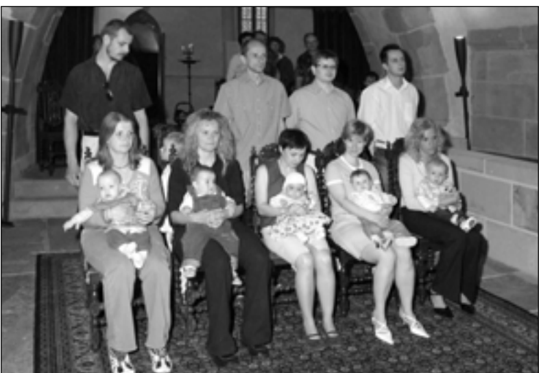
Vítání občánků – Bylo nás pět, budou si moci říct děti, které přivítal pan starosta 10. května 2008 v obřadní síni.