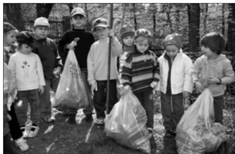
Děti nasbíraly plný pytel papírů, plastových i skleněných sklenic.

Snažíme se v dětech prohlubovat lásku k přírodě a věst je k její ochraně. Velkou příležitostí pro nás byl Den Země, který si připomínáme 22. dubna. Zájem dětí jsme vzbudili četbou z knihy bratřů Breuilových „Filipova další dobrodružství“, která svými příběhy a ilustracemi dětem přiblížila problém znečištění prostředí. Děti samy do příběhu vstupovaly a sdělovaly své zkušenosti a postřehy jak z domova, tak i z okolí. K svátku Zemi děti připravily na schodišti výstavku. Každý namaloval krásný obrázek toho, co se mu na Zemi nejvíce líbí. Děti samy formulovaly přání, některá opravdu originální. Přály Zemi, aby nekouřily tovární komíny, aby rybičky měly pořád čistou vodu, aby nikdo nelámal stromčky a aby všude kvetly kytičky. V herně jsme si vytvořili krásnou louku plnou kytiček, broučků a motýlků. Jaké bylo naše překvapení, když jsme se vrátili z vycházky a naše „louka“ byla plná odpadků. Děti se hned pustily do úklidu a nasbíraly plný pytel papírů, plastových i skleněných sklenic. Protože děti dobře znají možnost a důležitost třídění odpadu, rozhodli jsme se vyrobit si vlastní kontejnery na odpad. Do velkých krabic jsme vyřezali přiměřené otvory a natřeli je barvou, jakou mají kontejnery před školkou. Všechny na „louce“ posbírané odpadky jsme rozřídili podle druhů a povídali jsme si o možnosti další recyklace. Při vycházkách neustále objevu-