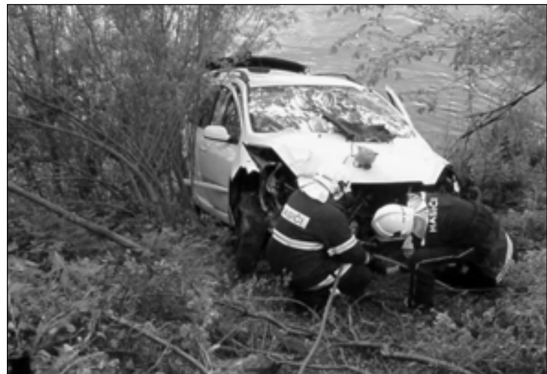
Roztočtí hasiči vytažují havarovaný vůz od řeky Berounky.

„Při průjezdu levotočivou zatáčkou nedaleko kempu nepřízvisobil řidič rychlost jízdy povaze vozovky, lekl se protijedoucího vozidla a najel na pravou krajnici. Vozidlo narazilo do skály, od které se odrazilo do protisměru, převrátilo se na levý bok, zpět na kola a sjelo do levého silničního příkopu,“ popisuje nehodu mluvčí Okresního ředitelství Policie ČR v Rakovnicku nrap. René Černý. „Osoby na zadních sedadlech nebyly připoutány. Při nárazu došlo k těžkému úrazu páteře u devatenáctileté spolujezdkyně. Řidič byl zraněn jen lehce,“ dodává nrap. Černý. Na místo byl povolán vrtulník letecké záchranné služby ze základny v Praze – Ruzyni a zraněnou ženu transportoval do Ústřední vojenské nemocnice v Praze.