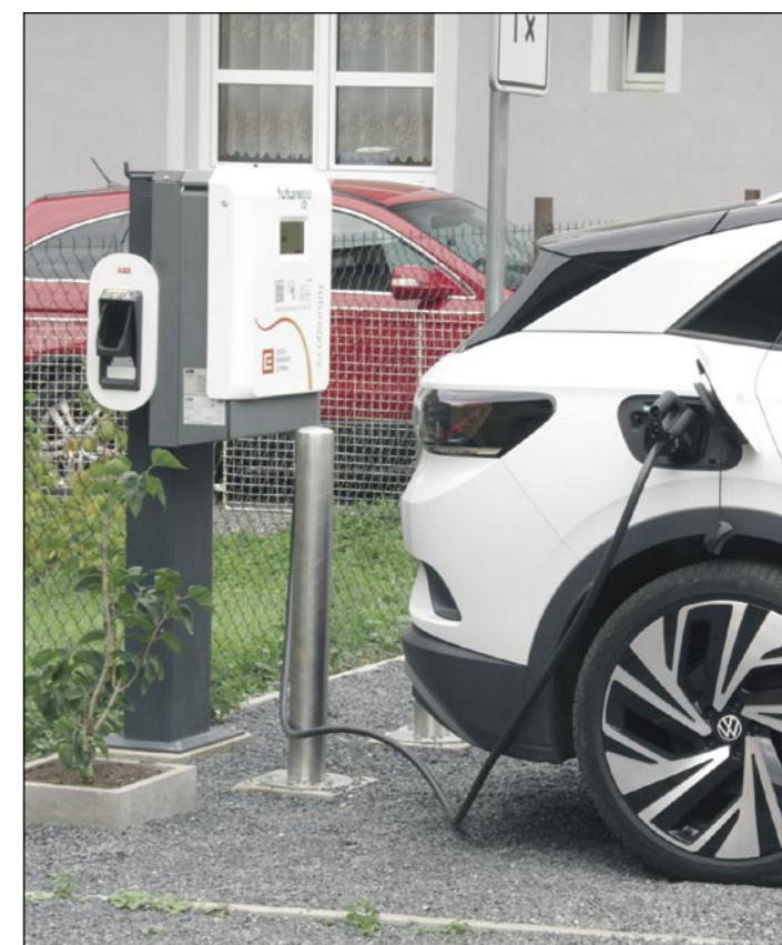
Veřejná dobíjecí stanice pro elektromobily v sousedství křivoklátské sokolovny.