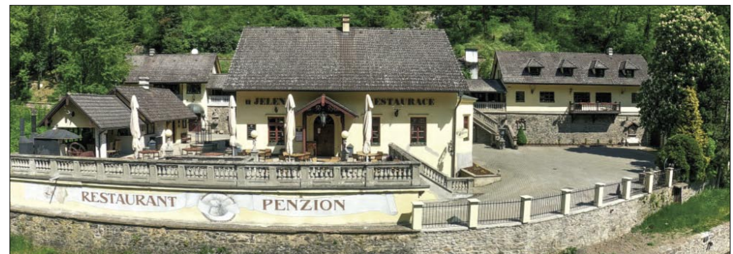
Resort U Jelena v Křivoklátě je opět v provozu.