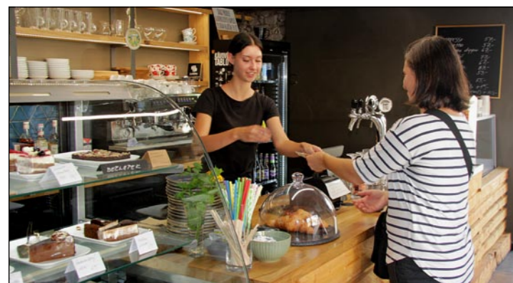
Přivítání budete v krásném interieru příjemnou obsluhou.