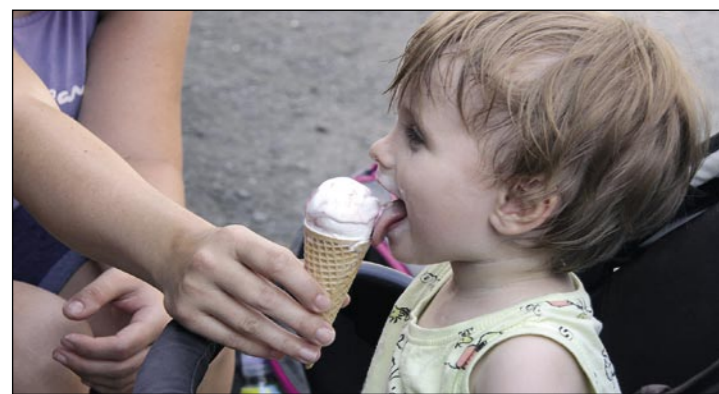
Malé návštěvníky jistě potěší výtečná zmrzlina.