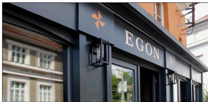
Firemní štít Café Egon z dálky zve hosty k návštěvě.

Aleš: To byl nápad ženy. Už během prvních dvou měsíců to vymyslela.