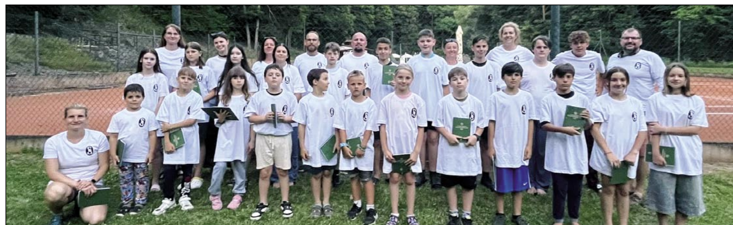
Účastníci sokolského tábora U Kolečka.