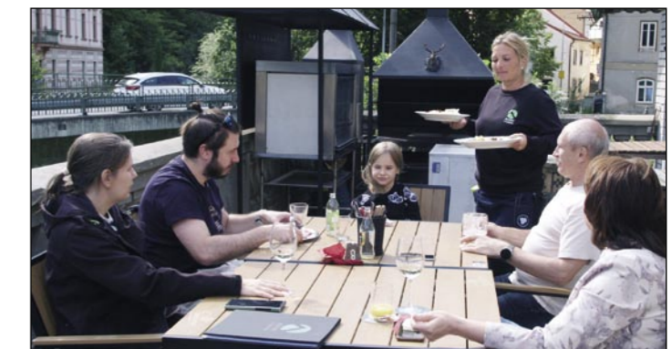
Spokojenost návštěvníků je tady vždy na prvním místě.