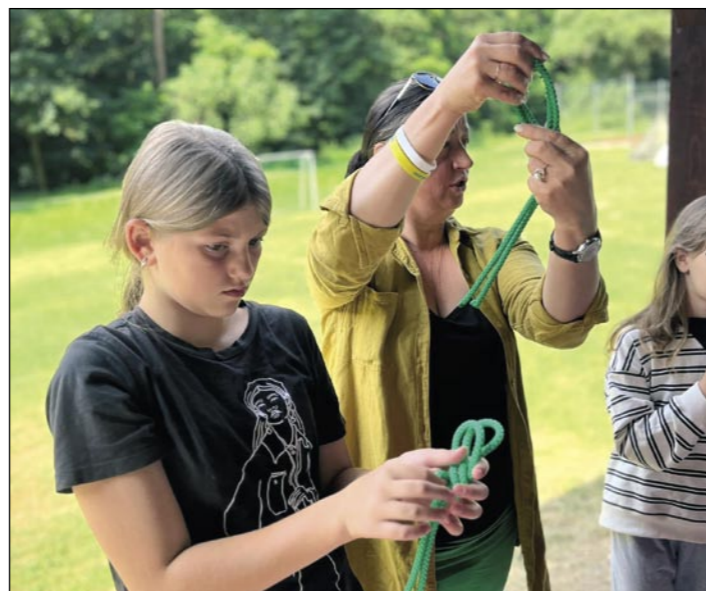
Táborníci se učili uzlovat.