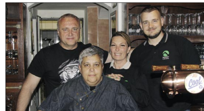
Personál resortu U Jelena, který vás zve na návštěvu.