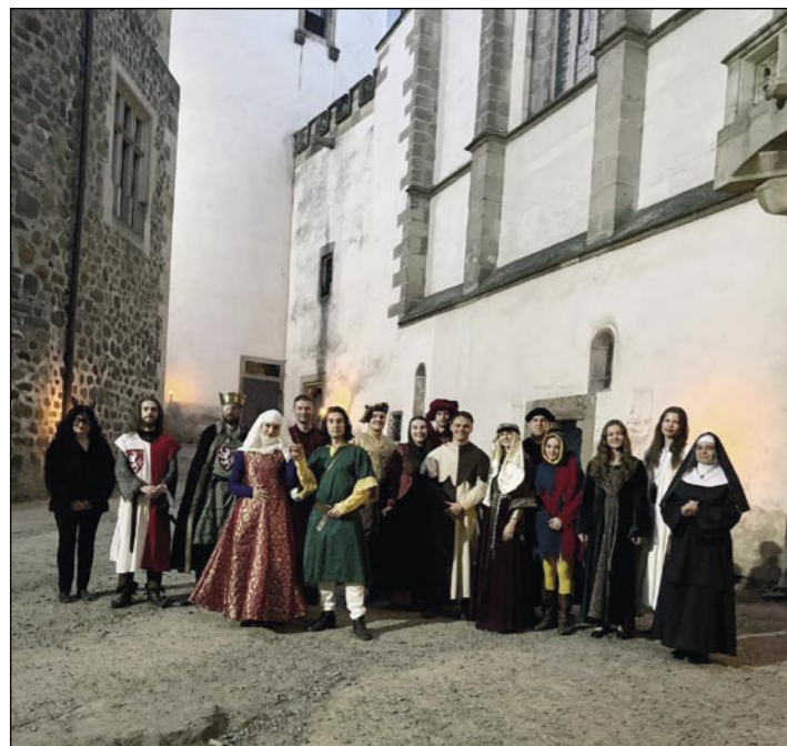
Akteři nočních scénických prohlídek se na vás těší.

Neváhejte proto s rezervací moc dlouho, protože kapacita je omezená a přihlášky bude možné přijímat pouze do jejího naplnění.