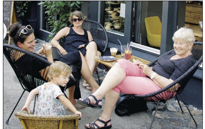
Úsměv hostů v Café Egon svědčí o tom, že zde je vše v naprostém pořádku.