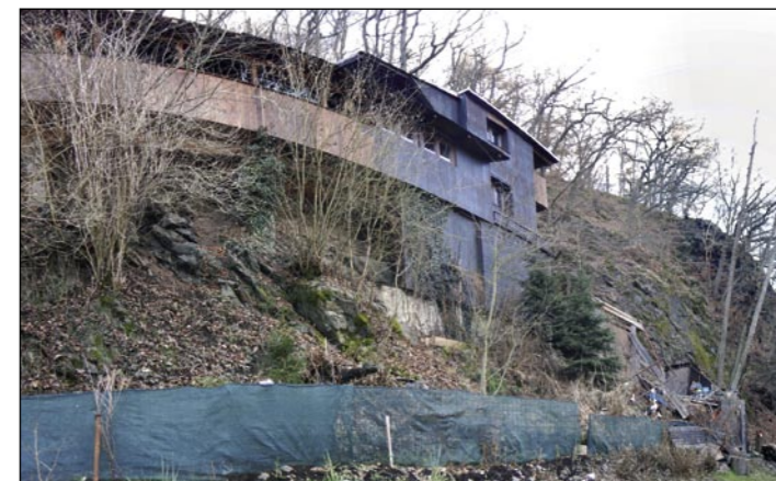
Fotografie dokumentující stav popisovaného problému.

„Mimořádně jsme zpřístupnili prohlídkový okruh Na hradby a velkou věž, to vše v ceně vstupenky na nádvoří. Trasa