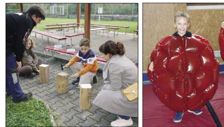
Během „Hravého odpoledne“ si děti vyzkoušely nejen svoji šikovnost, ale pořádně se i vyřádily při souborů „sumo“.