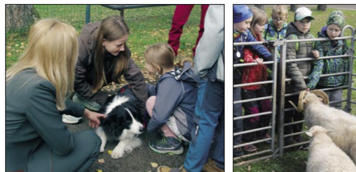
Nejvíce děti zaujala zvířata, která se nechala ráda pohladit.