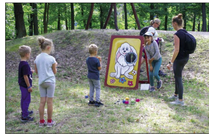
Jedna z disciplín Křivoklátského Boyardu – hod míčkem na cíl.