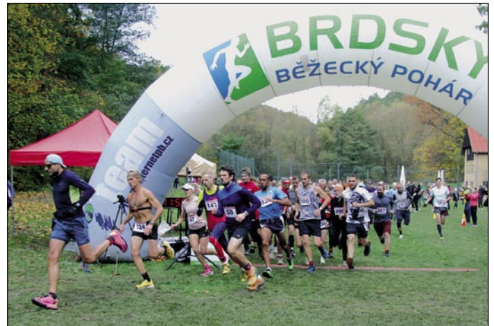
Start hlavního závodu 53. ročníku Malé křivoklátské.