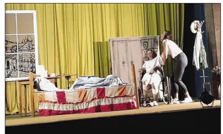
Výkony obou hereček byly skvělé, odvážné a uvěřitelné!