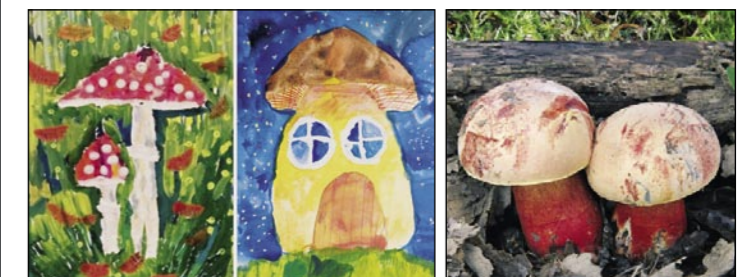
Fotografie z výstavy dětských kreseb a hub našich lesů.