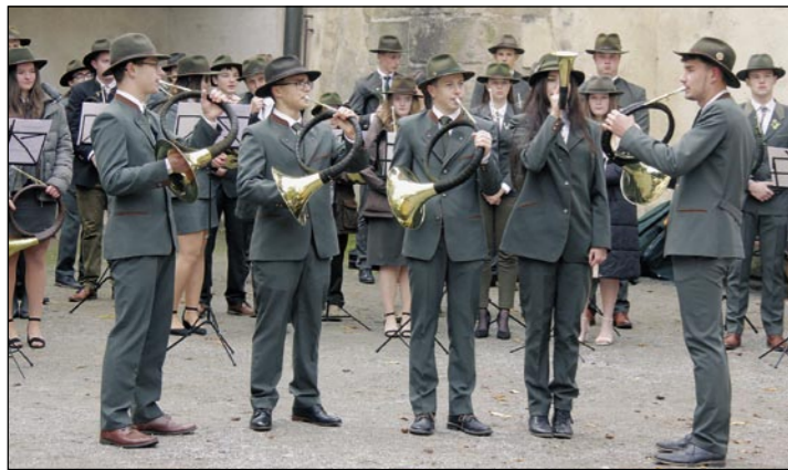
Trubači ze SLŠ a SOU Křivoklát při závěrečném koncertu na hradě Křivoklátě.