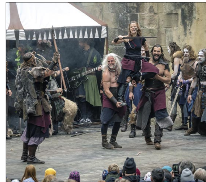
Program Křivoklání se nesl v duchu keltských legend..