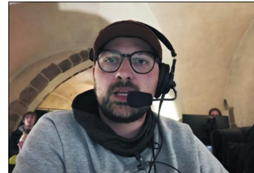
Režisér Markus Krug.