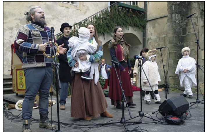
Kejklářská a žongléřská rodinná skupina Vagabundus Collective sehrála na hradě vánoční příběh.