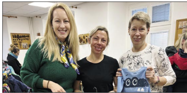
Poradatelky swapu mají důvod k úsměvu. Další povedená záslužná akce.