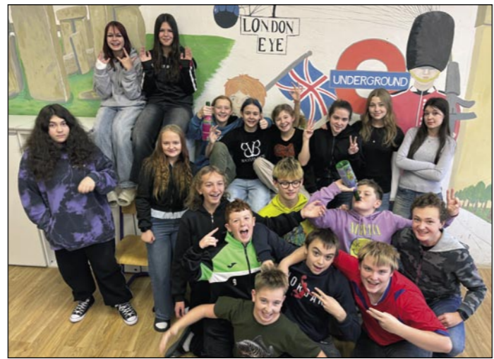
Sedmáci ze ZŠ Krivoklát - vítězové celorepublikové soutěže.