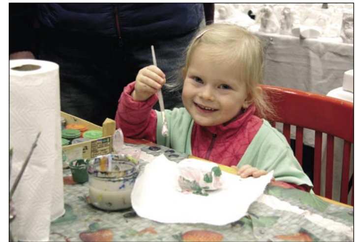
Pro nejmenší děti zde pořadatelé připravili výtvarné dílničky.