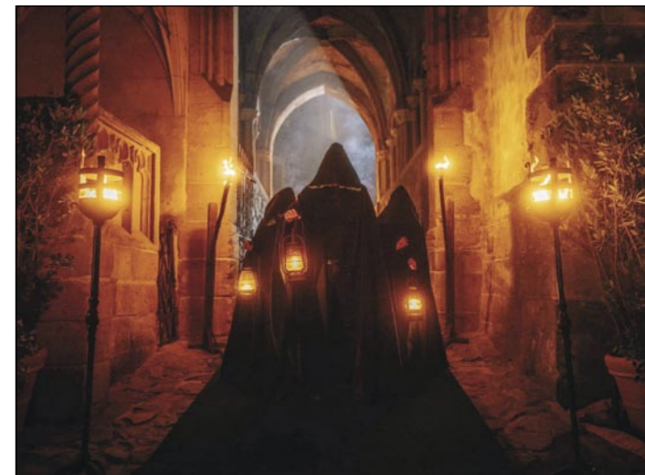
Každou noc se scházeli zrádci na konkláve, aby „zavraždili“ jednoho z věrných.

Produkce využila hradní prostory beze zbytku. Snídaně hráčů se konaly v Královském neboli Velkém rytířském sálu. Knížecí knihovna, obrazárna a muzeum sloužily jako místnosti, kde se hráči setkávali nebo v nich odpočívali. Konkláve, při níž zrádci „vraždili“ věrné, se konaly v jedné z věznic. Příslušy zrádců na severním parkánu u „pruhované“ bašty. Kulatý stůl byl umístěn v bývalé hradní spílce, která ovšem dnes není součástí prohlídkového okruhu a návštěvníci ji mohou vidět jen při velikonocích nebo adventních trzích. Hradní pán měl svoji komnatu, kde přijímal hráče, na oratoři kaple. Hojně byly využívány i venkovní prostory: na prvním (dolním) nádvoří se odehrálo několik epizod, na hradbách u velké věže často soutěžící diskutovali, v permanenci byla i hradní zahrádka na parkánu. Několik záběrů bylo pořízeno i v podzemní chodbě v severní frontě hradu a pod purkrabstvím v západní části hradu. Jedna z emotivních