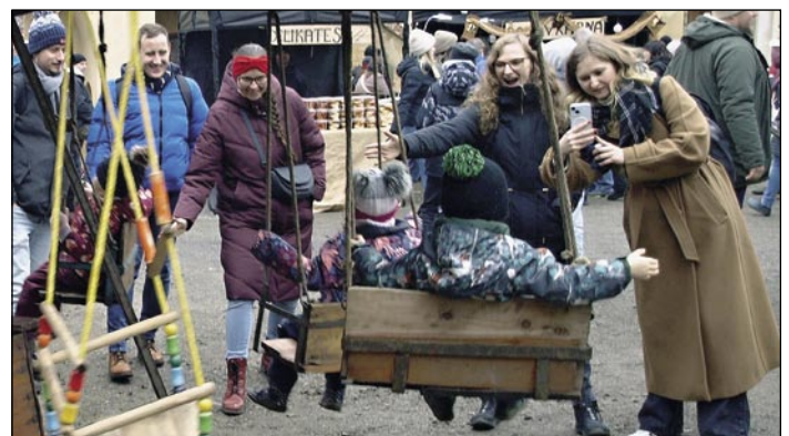
Atrakcí, zejména pro děti, byl kolotoč na ruční pohon.