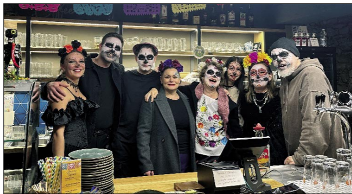
Pamětní fotka party kostlivců – organizátorů akce z kavárny Egon a Hotelu Sýkora.