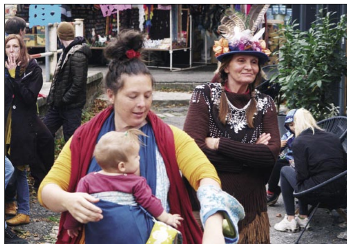
Návštěvníci si zde mohli připadat jako na peruánském tržišti.