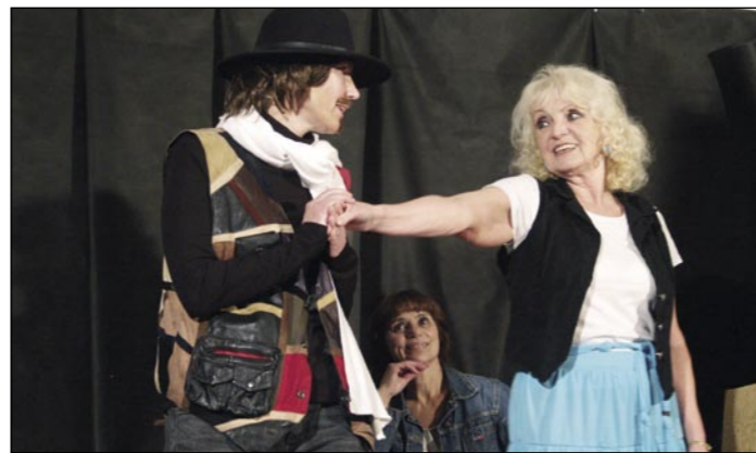
Romantický muzikál Sejšov si návštěvníci představení moc užili.

Neuběhl ani měsíc a v sokolovně se opět rozzářily jevištní reflektory. V sobotu 8. listopadu jsme totiž přivítali populární divadelní spolek Lumír s jejich autorskou hrou Sejšov aneb láska vrátí čas. Autorkou scénáře a textů písní je Vlasta Svárová.